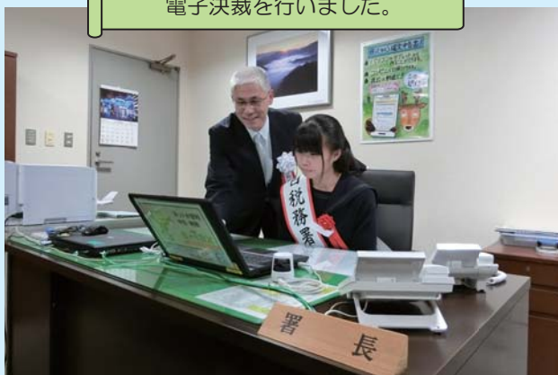
電子決裁を行いました。