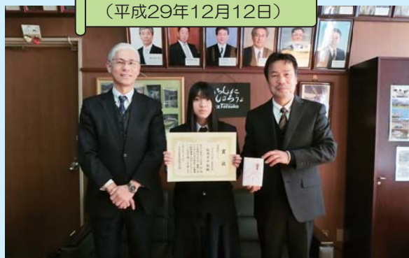
十津川高等学校にて (平成29年12月12日)