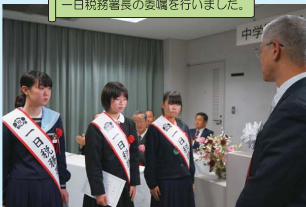
一日税務署長の委嘱を行いました。