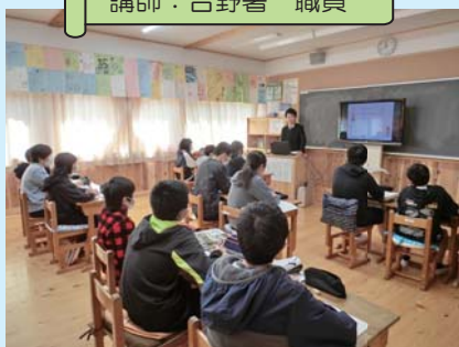
十津川第二小学校 講師：吉野署 職員