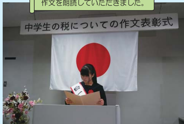
作文を朗読していただきました。