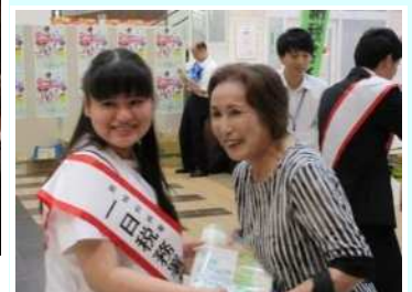
一日税務署長等(葛城租推協)