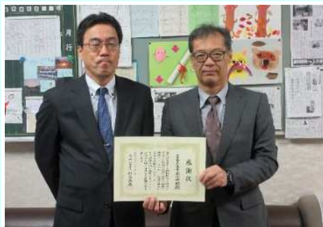
王寺町立 王寺北小学校