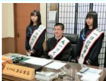
一日税務署長等(吉野租推協)