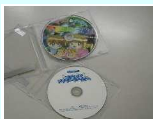
マリンとヤマト 不思議な日曜日 アナザー・ワールド