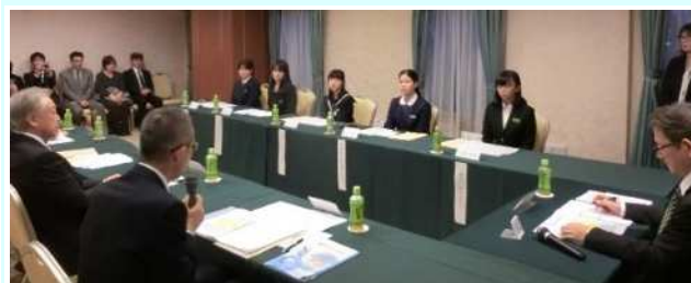
税の作文受賞者との座談会(奈良租推協)