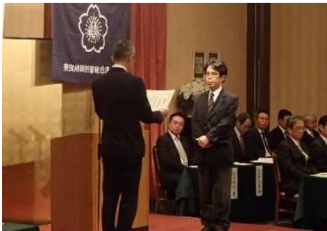
学校法人奈良育英学園 育英西中学校

租税教育の推進及び租税教育推進のための基盤整備等について、他の模範となる活動を行うなど、特にその功績が認められた学校等に対して租税教育推進校の表彰制度を設けています。奈良県下では、今年度、以下の学校が租税教育推進校として署長表彰を受けました。