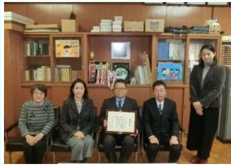
宇陀市立 榛原西小学校