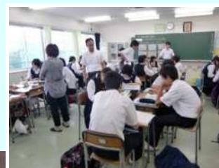
グループ・ワーク