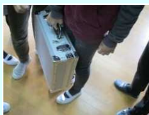
1億円入りジェラルミンケース