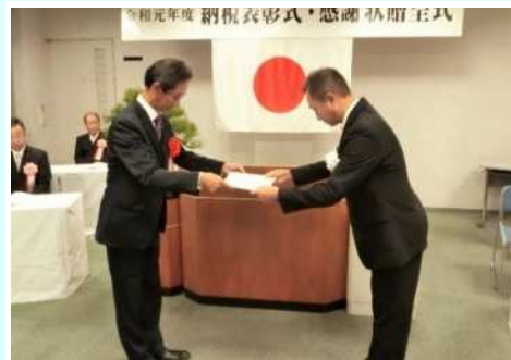
大淀町立 大淀希望ヶ丘小学校