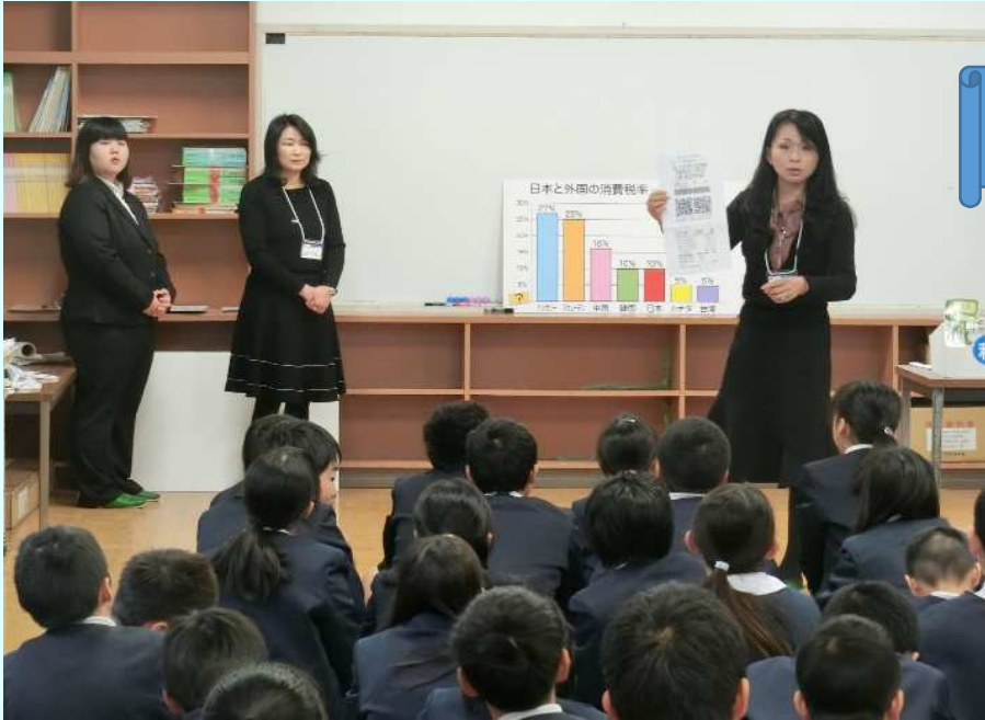
令 2.1.22 三宅小学校 桜井納税協会（女性部）