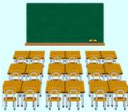
令元 12.13 榛原東小学校 中南和県税事務所